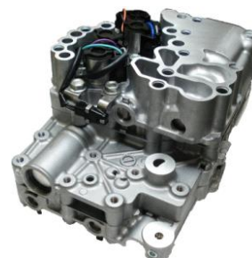
コントロールバルブ